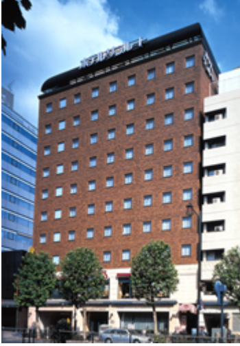
호텔 썬루트 아사쿠사