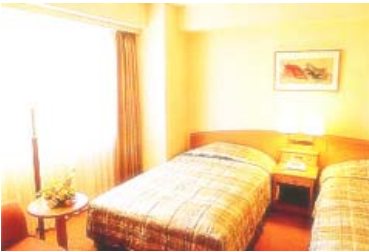
특별 투원 룸